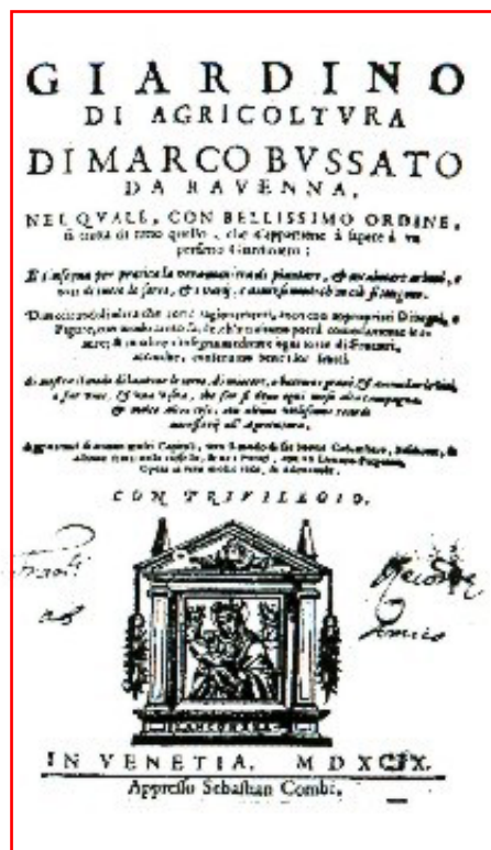
Frontespizio del "Giardino" del 1590. Da un esemplare custodito presso la Biblioteca Classense, Ravenna.