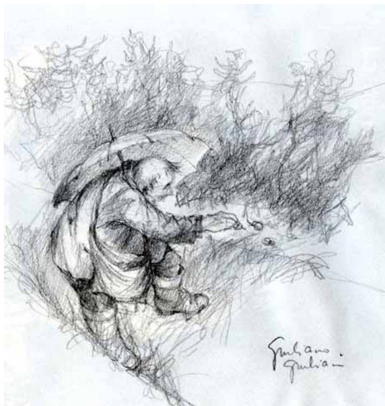
Giuliano Giuliani, A lumêgh .

Con tutto l'antisemitismo che c'è al mondo ci manca pure quello delle lumache... romagnole.