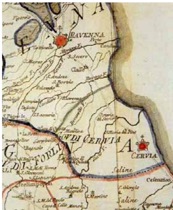
I fiumi fra Cervia e Ravenna in una carta di Gio. N. Cassini Roma, 1824. Tav. II Romagna, particolare. Biblioteca Comunale di Forlì. Raccolte Piancastelli.

Era difficile capire che non si fermava con le armi la forza dell'acqua, ma l'intenzionalità umana. Una falla sull'argine destro o sinistro, a monte o a valle di un certo luogo, quante diverse conseguenze avrebbe potuto avere?!