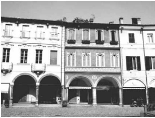
Casa Saralvo a Cesena, in Piazza del Popolo