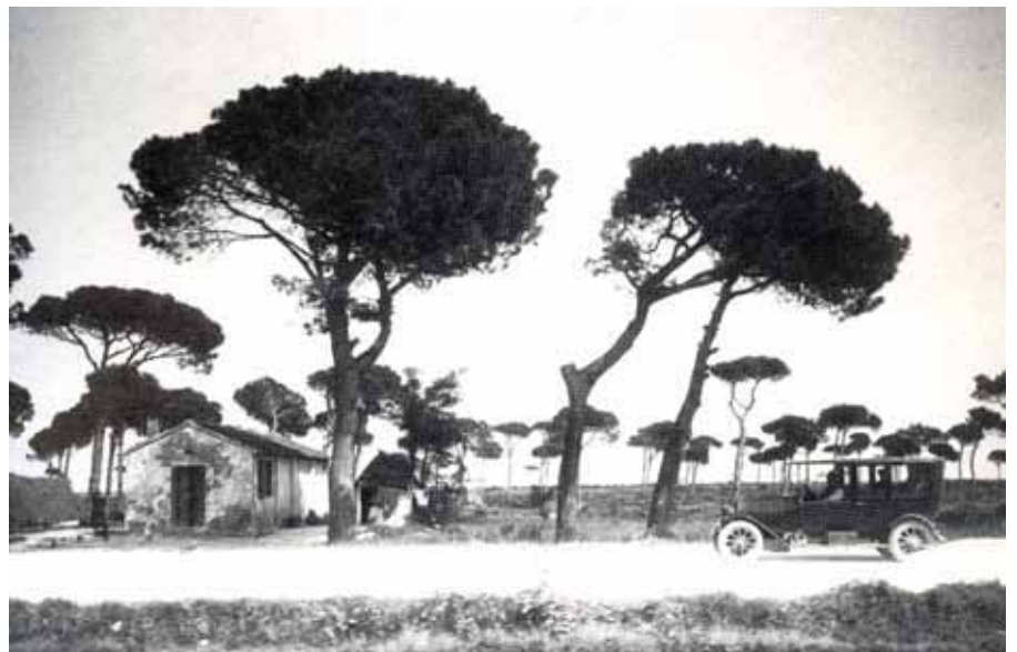
E' capân d'Ucileti alóra alóra...

Da cl'ètar cânt de' canél, impèt a nò, u j éra un cašòt ros in muradura